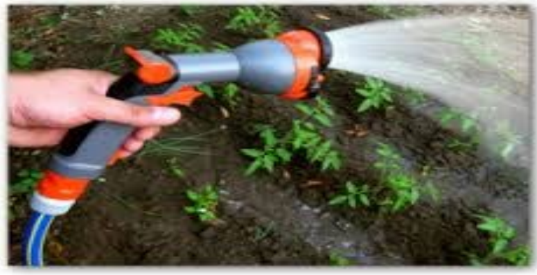
آبیاری با سرشیلنگ آبپاشی