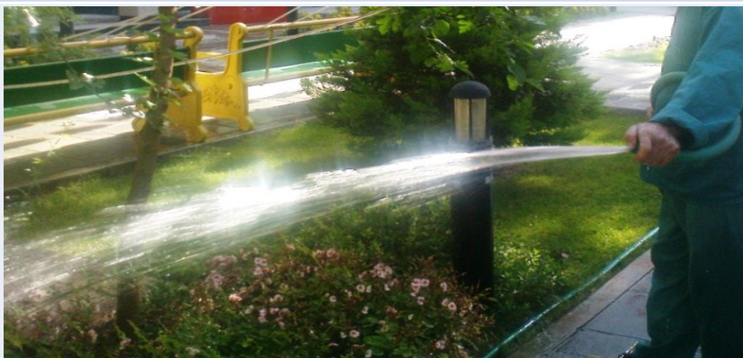
آبیاری با شیلنگ